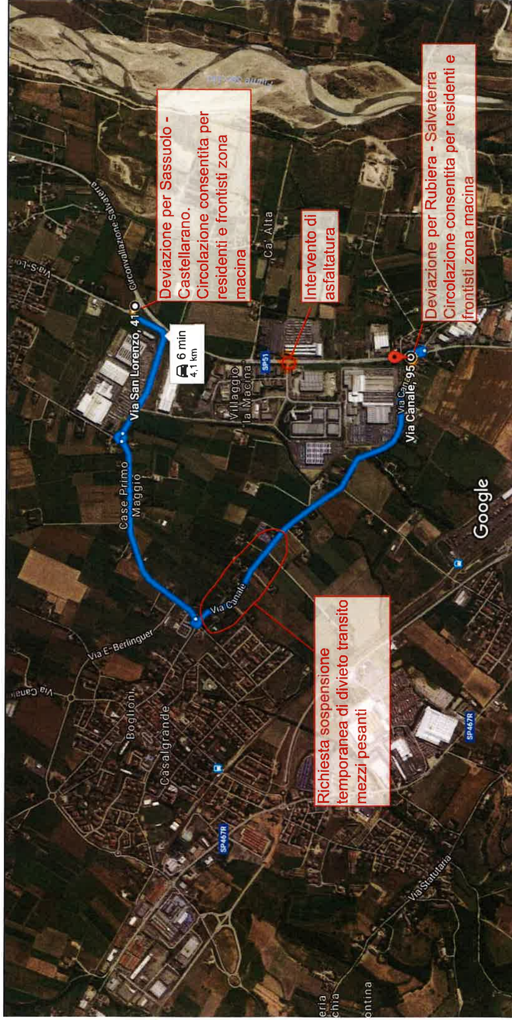
200 m

Chiusura al traffico SP51 e indicazione della deviazione di collegamento tra Rubiera e Sassuolo